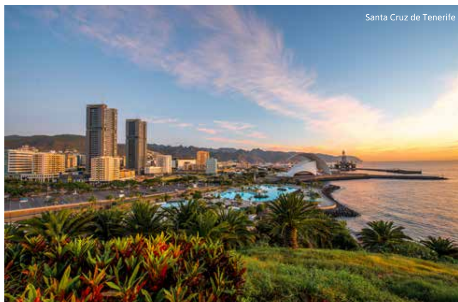
Santa Cruz de Tenerife