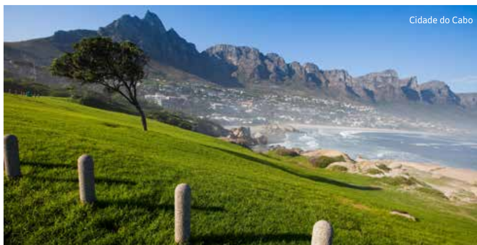
Cidade do Cabo